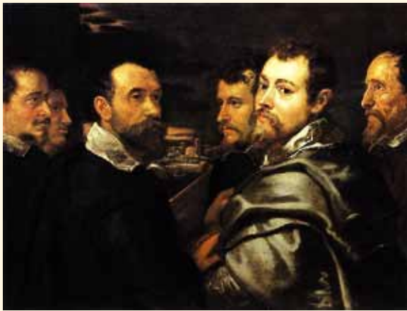
Pieter Paul Rubens - Autoritratto con amici a Mantova, 1602-1604. Olio su tela